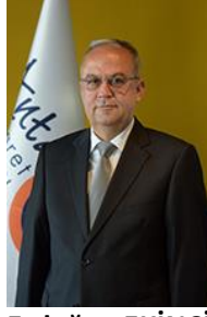
Erdoğan EKİNCİ Meclis Başkanı