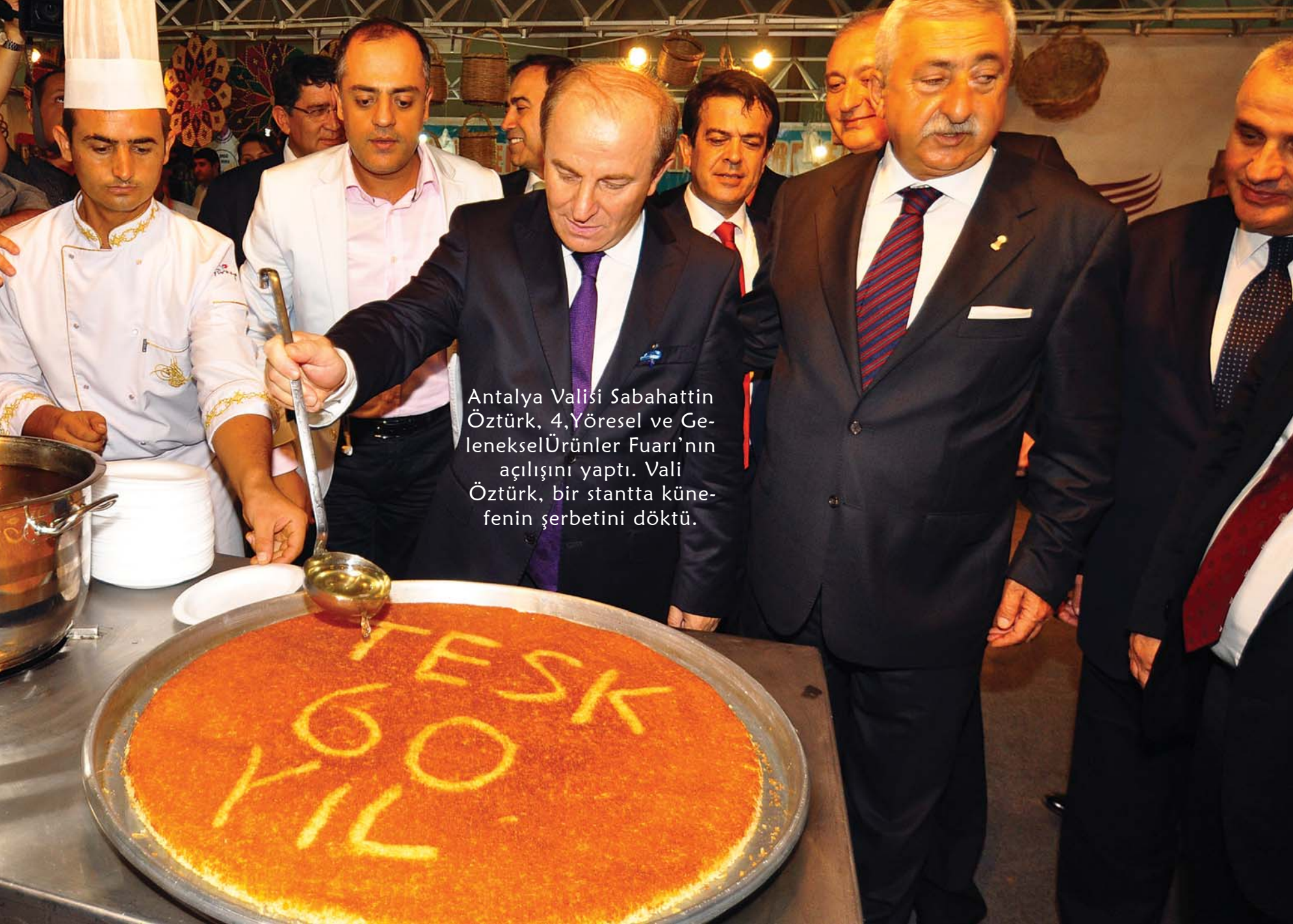
Antalya Valisi Sabahattin Öztürk, 4.Yöresel ve Geleneksel Ürünler Fuarı'nın açılışını yaptı. Vali Öztürk, bir standta künefenin şerbetini döktü.