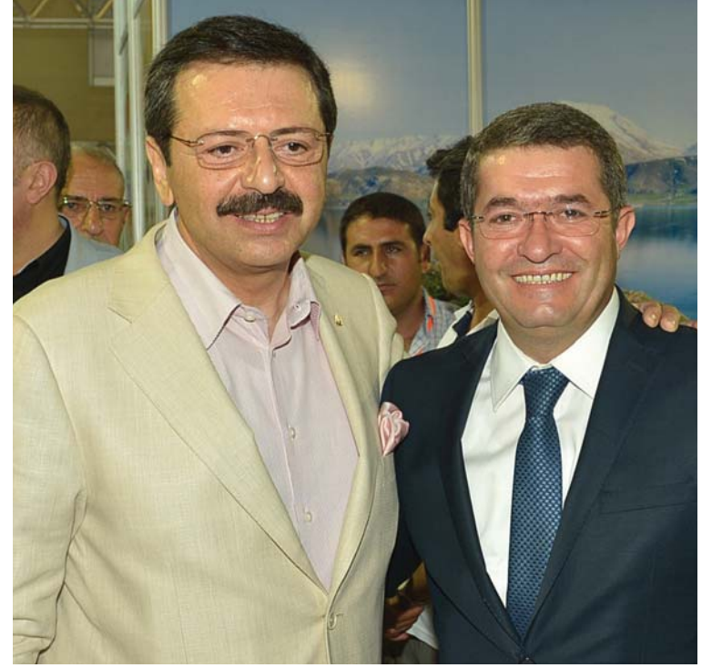
Kedisi, kahvaltısı ve halısıyla nam salan Van fuardaki yerini aldı.