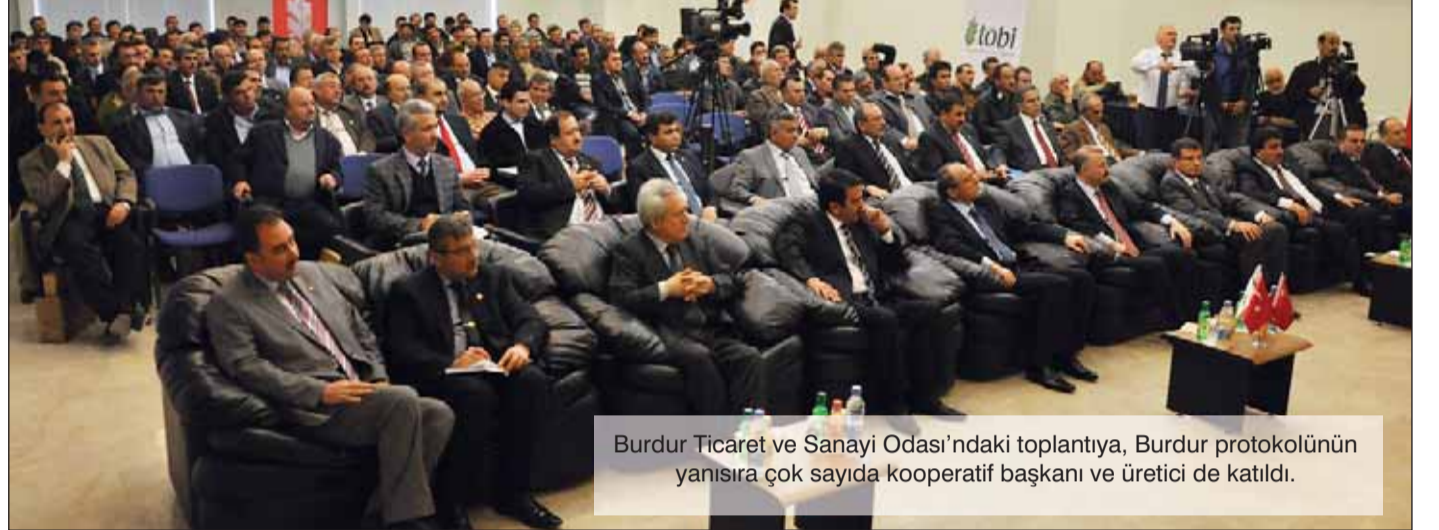
Burdur Ticaret ve Sanayi Odası'ndaki toplantıya, Burdur protokolünün yanısıra çok sayıda kooperatif başkanı ve üretici de katıldı.